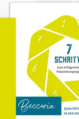
Beccaria Faltplyer „7 Schritte“